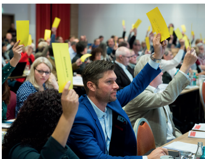
Abstimmung der ver.di-Bundestarifkommission in Berlin

Wir leisten gute Arbeit und gute Arbeit muss ordentlich bezahlt werden.